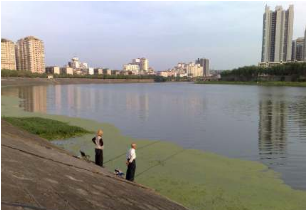
Vielä virtaa Leuvanjoki alavirtaan ja sammet kiiskittää kalastajia.

Läheittää faksilla nöyrin täystoimittajanne täältä sinne.