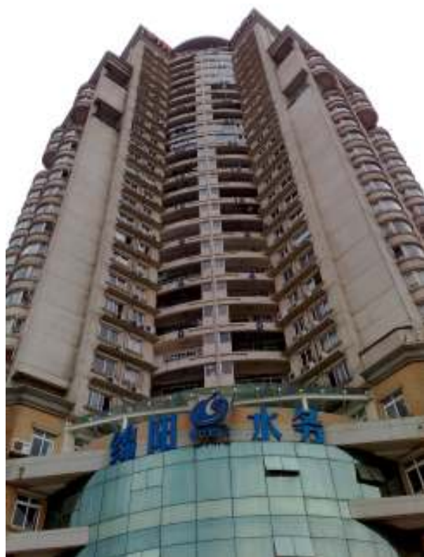
Kaupungin lämpömittari kerrostalon seinässä korkeus n. 20 kerrosta, asteet vain +40:n saakka, yövalaistuksessa mahtavan näköinen.

Yksi ylivoimaisen hyvä asia täällä ulkomailla on suomeen verrattuna: täällä kaikki kaupat ovat auki joka päivä melkein vuorokauden ympäri. Sitä asiaa alkaa arvostamaan yhä enemmän, kun aikaa on rajallisesti ja ruokaostokset on tehtävä oli pyhä tai sunnuntai, taikka kun vapaa-aika yllättää.