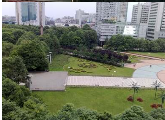
Säilörehu korjattu keskuspuistosta