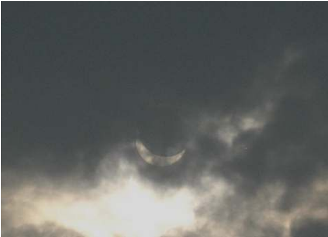
ReunaLeuvanjoella 22.07.2009 klo 08:59 Kuu on juuri estämässä auringonpimennyksen näkemisen...

Täältä sinne tänään, arvoisa kaihtajanne tervehtii teitä ylhäisiä siellä ylhäällä!