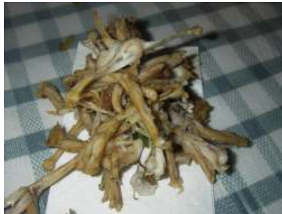
Sammakonreidet lounaaksi takaavat työinnon