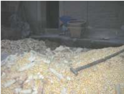
Maissin puinti aloitettu, taustalla sininen ryski