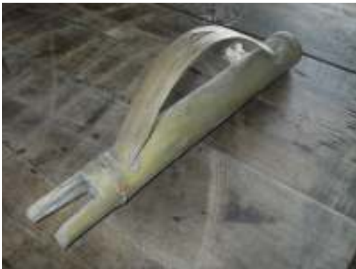
Bambusta on moneksi, tässä hiirenlisku