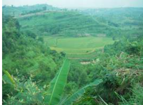
Siellä ne pellot on, laaksossa