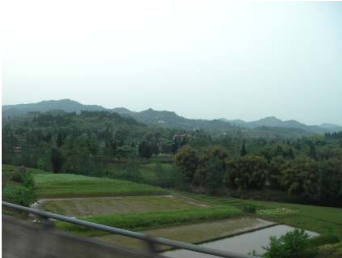
Näkymä entisen Oulun, tulevan Leuvanjoen, maantieteelliseen keskusta, etualalla Letuaari.

Epävarmana siitä, pitäisikö tässä tilanteessa onnitella vai ottaa osaa, toimittajanne vetäytyy ottamaan osaansa paikallisen panimon sammiosta. Täältä kaukaa on vaikea muuta kuin toivottaa onnea Oululle ja oululaisille, teitte hyvän valinnan!! Seuraavaksi tapaamme ilmeisestikin Suomen uusimmalla ja viimeisimmällä asutusalueella, Leuvanjoella. Hymyillään kun talikoidaan