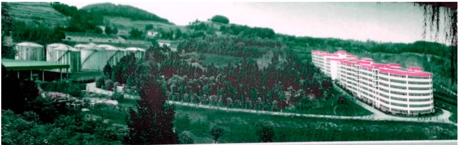
Kuvassa oikealla viinatehtaalle kuuluva hiivantuotantolaitos sekä vasemmalla n. 3 000 000 litraa viinaa!

Muuten kirjeenvaihtajallamme on ollut kiirusta viedessään Suomitietoutta noihin syrjäisiin ja harvaanasuttuihin kolkkiin Kiinassa. Toivottakaamme rohkealle sanansaattajallemme onnea ja toivokaamme selkokieliisiä raportteja mistä ikinäkään.