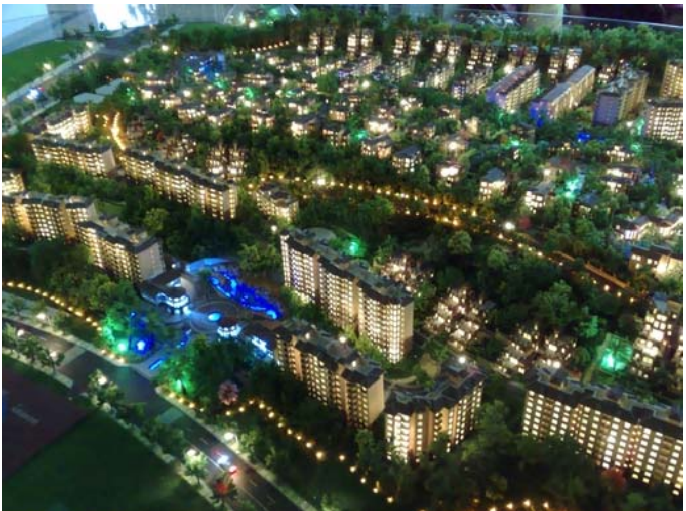
Leuvanjoen tulevaa esikaupunkia, suunnitelma 18248/09

Kylästrategia muuttuu julkisen hallinnon toimenpiteiden seurauksena dramaattisesti lähivuosien aikana. Voimmepa jopa joutua harkitsemaan osaltamme, hyväksymmekö huonommassa jamassa olevien alueiden yritykset liittyä Leuvanjoen toiminnalliseen kyläalueeseen. Tällä tavalla voisimme kuitenkin helpottaa huonompiosaisten ja muuten ehkä totaalisen romahduksen kohtaavien alueiden surkeaa kohtaloa tässä alati muuttuvassa lantskaapissa. Loppujen lopuksi suomalaisuus on se joka meidät pitää yhdessä, tai kahdessa promillessa.