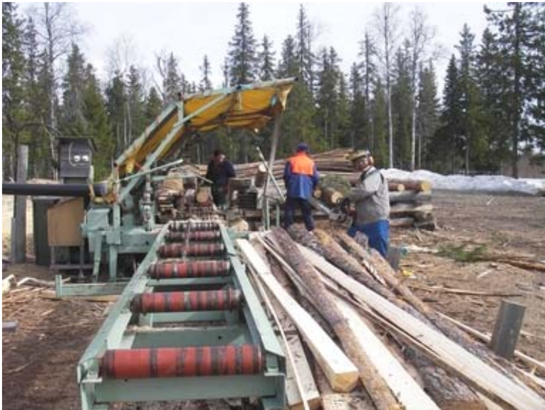
Leuvanjoen viimeinen saha( ensimmäinen vasemmalta) ja sohikaanit loson teossa.

Läksiäispuheissaan sohikaanit muistelivat pitkää ja ansiokasta ja vaiherikasta taivaltaan Leuvanjoen teollistuvan infrastruktuurin kehittämisessä, kaikki yhden ja yksi kaikkien puolesta! Tällä hetkellä vaikuttaa kuitenkin siltä että yksi aikakausi on päättymässä sohikaanien osalta Leuvanjoella, ainakin originellien yksilöiden kohdalla. Kehitys jatkuu kuitenkin ja uusia losoja nähdään vielä jatkossakin, sanoo aina oikeaan osuva arvuuttajakin!