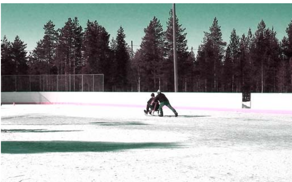
Parasta kakkosluokkaa vauhdissa...

Kiitokset Yli-Iin Marttoille mukavasta ja monipuolisesta tapahtumasta, hyvä että vielä on aktiivisia toimijoita täälläkin. Seuraavaa tapahtumaa odotellessa toimittajanne vetäytyy transkendenttiseen mietiskelyasentoon uusia uutisia etsien.