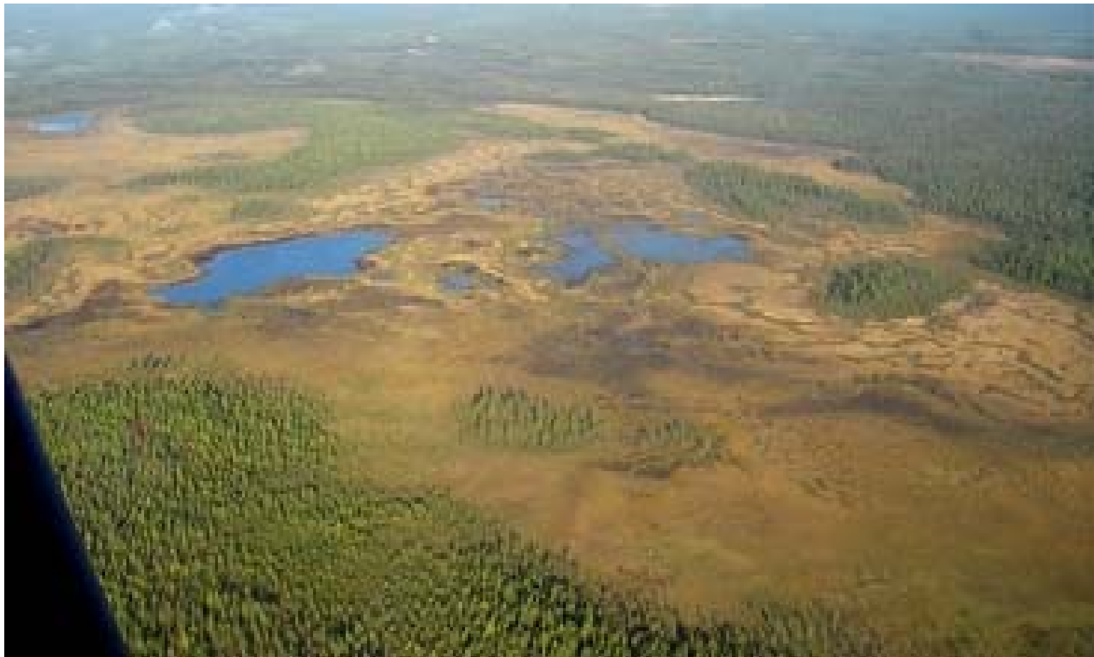
Kusisuo kesäisessä asussaan

Toivokaamme tulevasta vuodesta 2007 menestyksestä ja antoisaa kaikille tasapuolisesti!