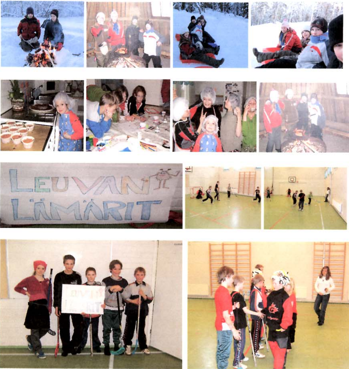
Voittajajoukkue ”Leuvan Lämärit”