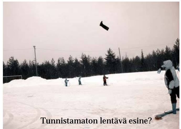
Tunnistamaton lentävä esine?