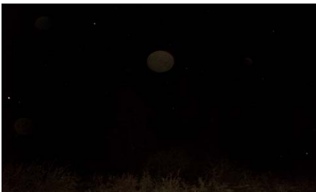
Leuvanjoen taivas 31.12.2005 klo 23.59.58

Samoin keväällä lumien sulamisen aikoihin uuden vuoden raketteilu avittaa luontoa kovasti: tasaisin välein lumessa ilmenevät mustat läiskät imevät tehokkaasti auringonvaloa ja edesauttavat lumen sulamista. Onkin todistettu, että lumi sulaa nykyisin viimeistään aikaisemmin kuin aikaisemmin myöhemmin, kuitenkin ainakin silloin kun viimeisetkin lumet ovat sulaneet! Näin kesät ovat pidempiä ja ainakin vähälumisempia, paitsi tietysti talvella mikäli silloin on lunta. Lehtemme toivottaa oikein hyvää ja antoisaa Uutta Vuotta ja muistakaa lähimmäisiänne!